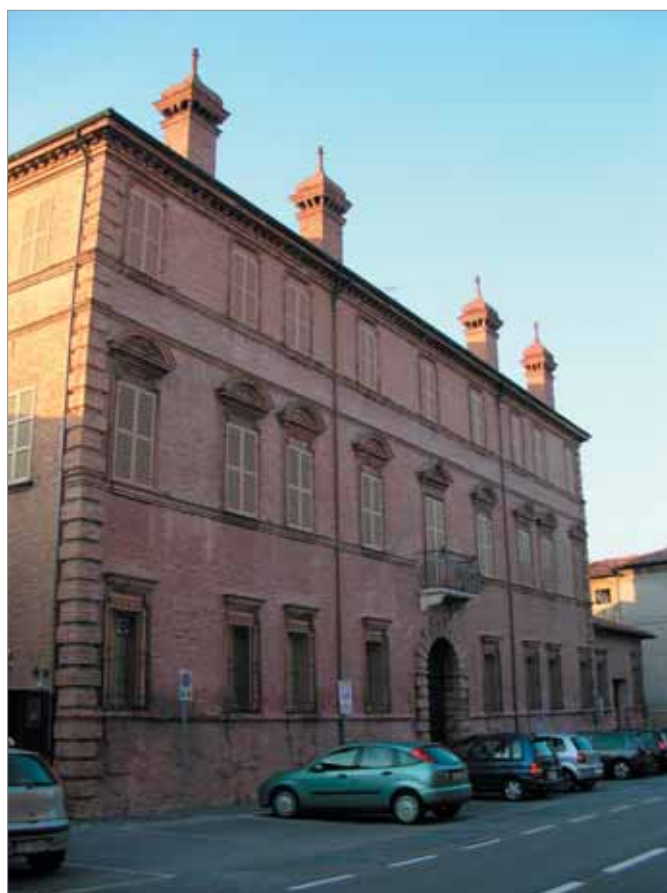
Corso Mazzini 98 Fronte Principale